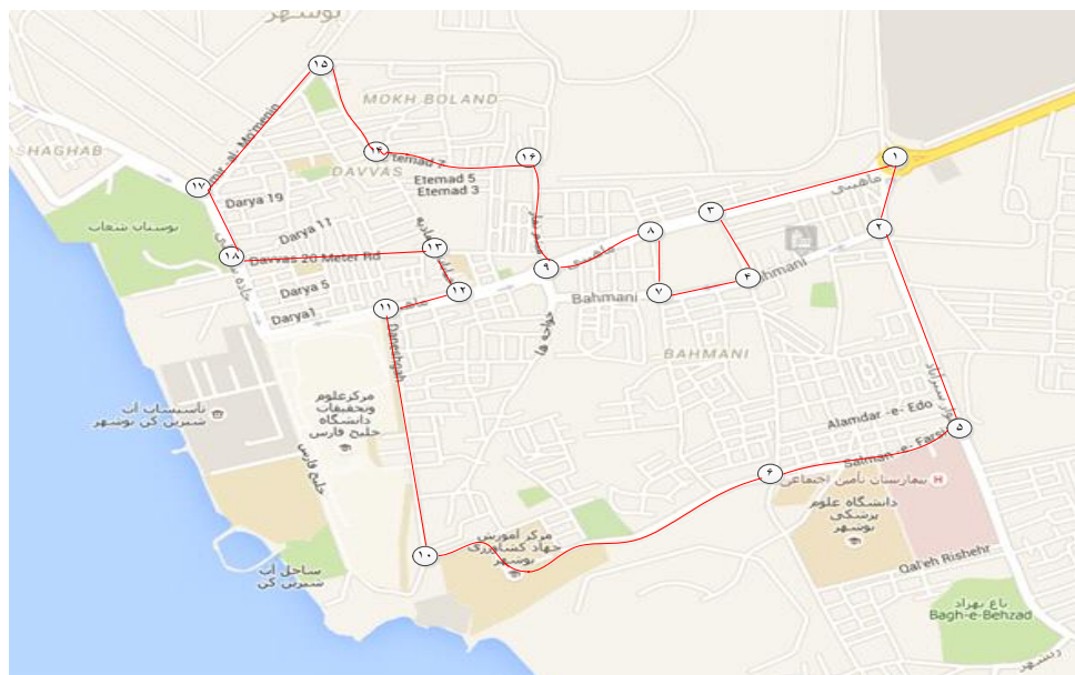
شکل شماره ۲: مسیر بهینه انتخاب شده

مدل ریاضی ارائه شده با استفاده از نرم‌افزار لینگو کد نویسی شد و سریع‌ترین مسیر ممکن برای ارزیابی همه این مناطق توسط تیم ارزیاب به دست آمد. مطابق نتیجه، از بین ۲۸ مسیر موجود بین ۱۸ گره، ۱۸ مسیر انتخاب شد که تیم ارزیابی می‌تواند با طی کردن این مسیر در کوتاه‌ترین زمان همه نقاط را ارزیابی کند. هوانگ و همکاران نیز در سال ۲۰۱۳ پژوهش مشابهی انجام دادند.