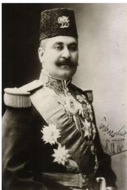
تصویری از صمدخان ممتازالسلطنه

۳- اعلان رسمی در باب قدغن بودن استعمال گلوله‌هایی که در بدن انسان به آسانی متلاشی و پهن می‌شود و کذالک گلوله‌هایی که لفافه اش ضخیم است... این قرارنامه‌ها و اعلانات رسمیه را بعد از غوررسی و تحقیق و تدقیق، قبول و ممضی داشتیم. چنان که به موجب این سطور آنها را تماماً ممضی و مجری می‌دانم و از طرف خودمان و ولیعهد و خلف خودمان قول می‌دهم که تمام فصول و مضامین این قرارنامه‌ها و اعلانات رسمیه بدون تخلف مجری خواهد شود به موجب این قبولی به دستخط خودمان این نوشته را امضا نموده و بنویسیم به مهر دولتی ممهور شود.