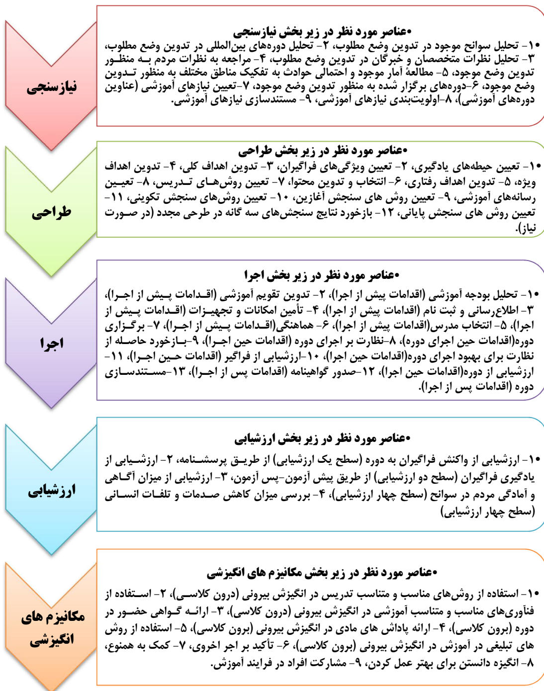
شکل شماره ۳- عناصر مورد نظر در مؤلفه‌های مدل آموزش همگانی

همچنین زیرمؤلفه‌های این مدل را در نمای شماتیک زیر (شکل شماره ۳) می‌توان مشاهده کرد: