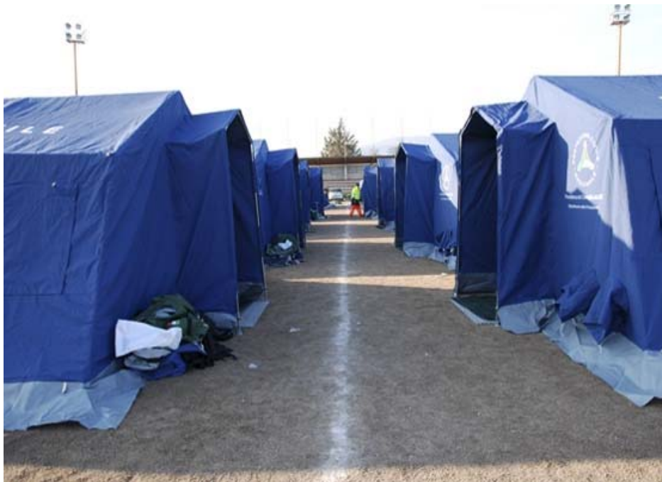
تصویر ۶: یکی از اردو گاههای بر پا شده در زلزله ایتالیا