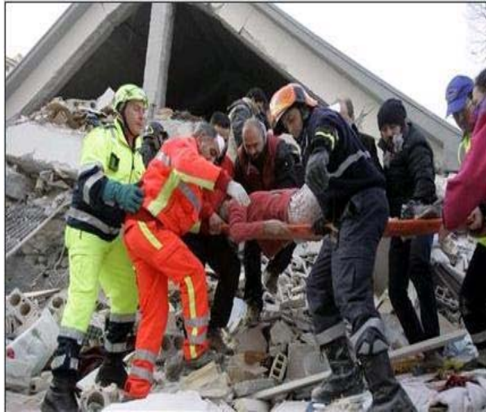
تصویر ۳: امدادگران در حال عملیات نجات