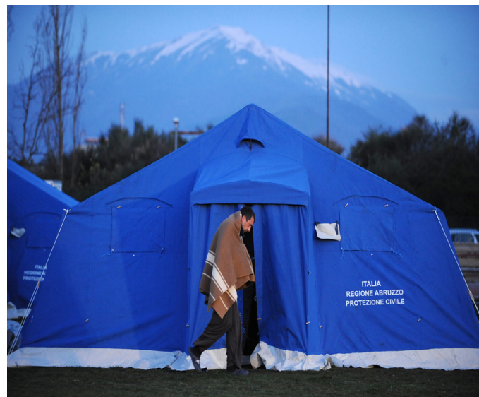
تصویر ۴: اسکان اضطراری مهیا شده توسط سازمان دفاع غیر نظامی ایتالیا